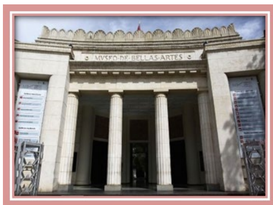
Museo de Bellas Artes – Caracas.

c. Museos regionales: son aquellos cuyas colecciones son representativas de una porción del territorio en el que están ubicados. Ejemplo: Museo de Arte Contemporáneo del estado Zulia. Museo Rafael Urdaneta, El Centro de Arte de Maracaibo Lía Bermúdez, Museo San Benito, Museo de Artes Contemporánea, El Museo de Artes de Coro (MUCOR), Museo de Arte Moderno Jesús Soto, Ciudad Bolívar. Museo de Arte popular Occidente Salvador Valero, Trujillo.