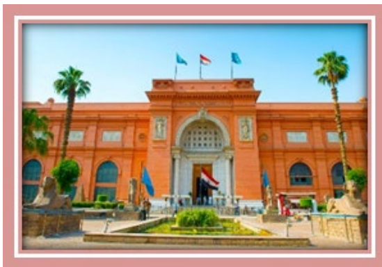
Museo Egipcio (El Cairo)