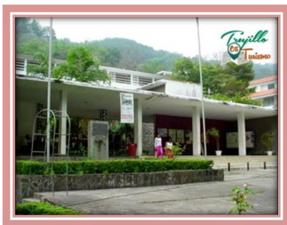
Museo de Arte popular Occidente Salvador Valero, Trujillo.

c. Museos regionales: son aquellos cuyas colecciones son representativas de una porción del territorio en el que están ubicados. Ejemplo: Museo de Arte Contemporáneo del estado Zulia. Museo Rafael Urdaneta, El Centro de Arte de Maracaibo Lía Bermúdez, Museo San Benito, Museo de Artes Contemporánea, El Museo de Artes de Coro (MUCOR), Museo de Arte Moderno Jesús Soto, Ciudad Bolívar. Museo de Arte popular Occidente Salvador Valero, Trujillo.